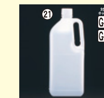
21 2L-HO(N) H270×W112×L108(2,000ml) 30入 材質PE