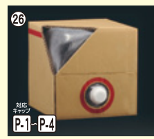
26 キュービ容器 18L 本体+CAPセット 段ボールは別売りです H285×W285×L295 100入 材質PE