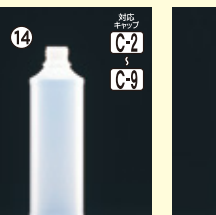
14 MU-300(N) 53φ×H175(300ml) 240入 材質PE