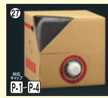
27 キュービ容器 20L 本体+CAPセット 段ボールは別売りです H285×W295×L295 100入 材質PE