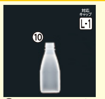
10 豆乳PPF-200角 H133×W52×L52(200ml) 500入 材質PP 耐熱