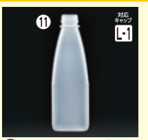
11 豆乳PPF-1L角 H246×W80×L80(1,000ml) 128入 材質PP 耐熱