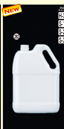
282 4L-HO-F 乳白(NF) H273×W190×L115(4,000ml) 20入 材質PE