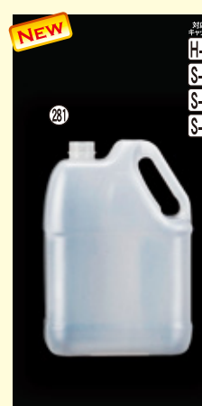
281 4L-HO-F ナチュラル(NF) H273×W190×L115(4,000ml) 20入 材質PE