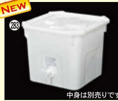
283 RIC 20-1 H304×W364×L364(20L) 10入 材質PP