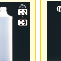
16 MU-500(N) 66φ×H200(500ml) 138入 材質PE