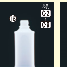
13 MU-200(N) 53φ×H123(200ml) 336入 材質PE