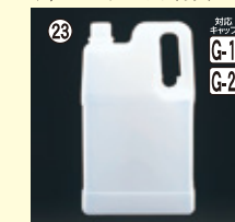
23 2.5L-HO(N) H258×W156×L95(2,500ml) 28入 材質PE