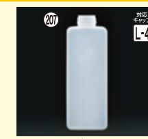
207 PP-1L角-広口 H220×W78×L69(1,000ml) 100入 材質PP 耐熱