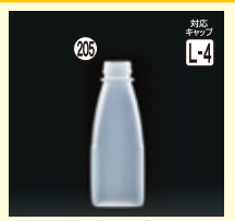
205 PPF-500角-広口 H188×W68×L68(500ml) 220入 材質PP 耐熱