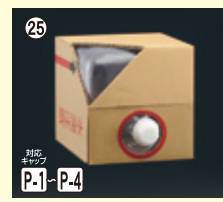
25 キュービ容器 10L 本体+CAPセット 段ボールは別売りです H240×W240×L240 100入 材質PE