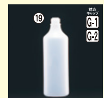
19 1L-SH(N) 82φ×H249(1,000ml) 66入 材質PE