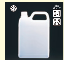
22 2L-SSO(N) H214×W142×L96(2,000ml) 38入 材質PE