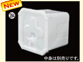
284 RIC 20-2 H304×W364×L364(20L) 10入 材質PP