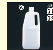
20 1.8L-HO(N) H280×W99×L118(1,800ml) 30入 材質PE