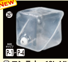
287 ロンテナー-18L ML H278×W278×L278(18L) 100入 材質PE