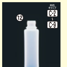
12 MU-100(N) 38φ×H123(100ml) 500入 材質PE