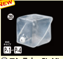
285 ロンテナー-5L ML H200×W200×L200(5L) 100入 材質PE