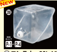
288 ロンテナー-20L ML H285×W285×L285(20L) 100入 材質PE