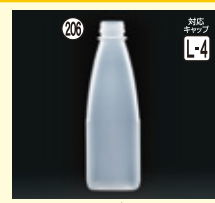
206 PPF-1L角-広口 H246×W80×L80(1,000ml) 128入 材質PP 耐熱