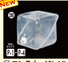
286 ロンテナー-10L ML H230×W230×L230(10L) 100入 材質PE