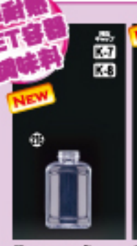
SS-240角 H113×W68×L46(240ml) 288入 材質PET