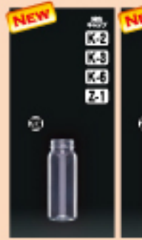
M-PET 100F-PF 40φ×H108(115ml) 450入 材質PET