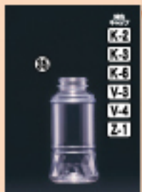
F-PET150F 55φ×H113(150ml) 450入 材質PET