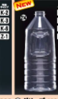
グリップ 1000 85φ×H258(1,000ml) 84入 材質PET