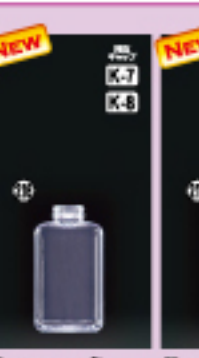
SS-340角 H126×W70×L53(340ml) 222入 材質PET