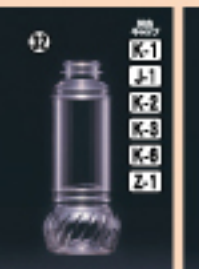
ドレッシング 285-SG 66φ×H161(285ml) 250入 材質PET