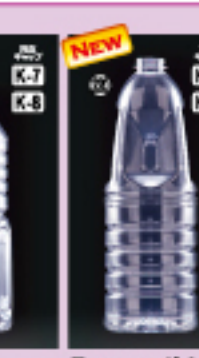
SS-1L 85φ×H258(1,000ml) 100入 材質PET