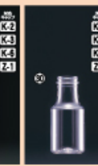
M-PET 300F-VR 54φ×H187(322ml) 200入 材質PET