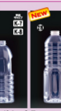
SS-1Lグリップ 92φ×H221(1,000ml) 84入 材質PET