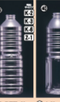
G-PET 1L 80φ×H254(1,000ml) 147入 材質PET