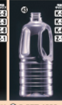
グリップ 1500M 105φ×H255(1,536ml) 72入 材質PET