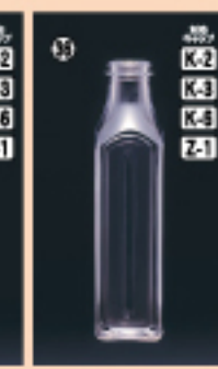
G-150 52φ×H115(150ml) 400入 材質PET