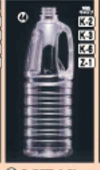
G-PET 1500 105φ×H256(1,500ml) 90入 材質PET