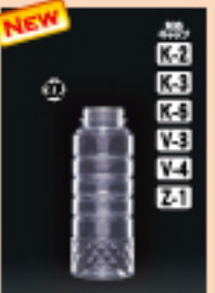
ドレッシング180-SG 50φ×H128(195ml) 450入 材質PET