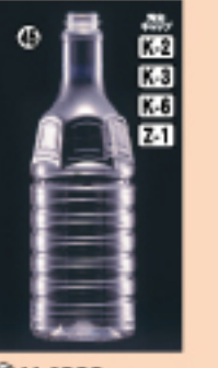
G-PET 1.8L 105φ×H311(1,800ml) 80入 材質PET