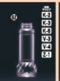
ドレッシング200-SG 57φ×H143(200ml) 350入 材質PET