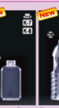
SS-370角 H131×W70×L55(370ml) 218入 材質PET