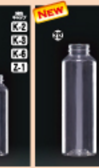
N-PET 200F-VR 50φ×H137(220ml) 250入 材質PET