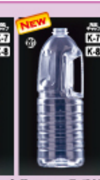
SS-1.8Lグリップ 105φ×H305(1,800ml) 90入 材質PET