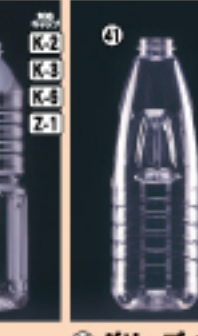
J-1L 80φ×H280(1,000ml) 94入 材質PET