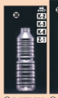
G-PET 500 64φ×H204(500ml) 180入 材質PET