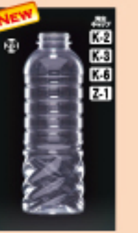
G-PET 360 58φ×H178(360ml) 220入 材質PET