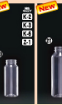
M-PET 100F-VR 42φ×H108(122ml) 480入 材質PET