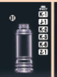
ドレッシング 220-SG 57φ×H141(220ml) 340入 材質PET