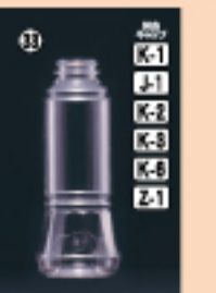
ドレッシング 300-SG 65φ×H163(300ml) 250入 材質PET