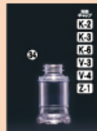
M-PET100F 54φ×H91(100ml) 450入 材質PET