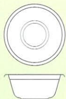
Size \Phi 165×75 (m/m)