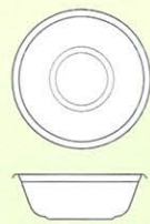
Size \Phi 154×54 (m/m)