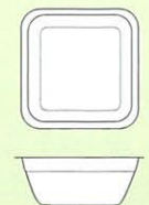
Size 148×148×60 (m/m)