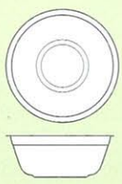
Size \Phi 180×67 (m/m)