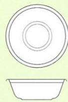
Size \Phi 160×68 (m/m)